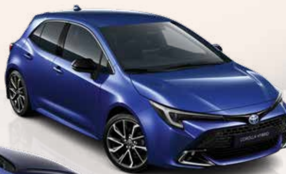
Enkeltfarver til Corolla 3