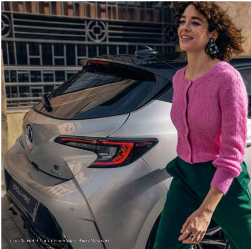
Corolla Hatchback markedsføres ikke i Danmark.

Corolla er både dynamisk og sofistikeret i sit indre og har et flot udvendigt design, der afspejler bilens indre værdier. Den smukke profil understreges af mulighed for sportslige 18" alufælge 1 , en lav motorhjelme og en flot aerodynamisk taglinje. Når man ser bilen forfra og bagfra, kan man se dens stolte positur, der understreges af den brede og markante kølergrill og flotte LED-forlygter 1 . En række forskellige, imponerende alufælge i flot design og et bredt udvalg af friske lakfarver understreger Corollas elegante sportslighed. Er du klar på at gøre indtryk? Den kække GR SPORT Corolla vidner om Toyotas arv fra motorsportens verden samt mange enestående sportsvogne i et unikt og spændende design.